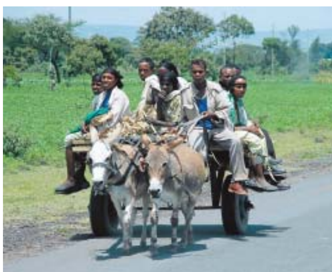
Eselskarren sind auf dem Land oft das einzige Transportmittel.

Auch am Neujahrstag am 11. September feiern die Kinder fröhlich: Sie gehen in traditioneller Kleidung mit einer Trommel von Haus zu Haus, singen – und erhalten dafür kleine Süßigkeiten. So wie an Halloween die Kinder in den Vereinigten Staaten.