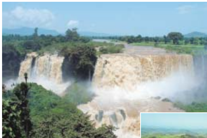
Oben: Die Wasserfälle des Blauen Nils. Rechts: Weite, grüne Ebene im Norden.