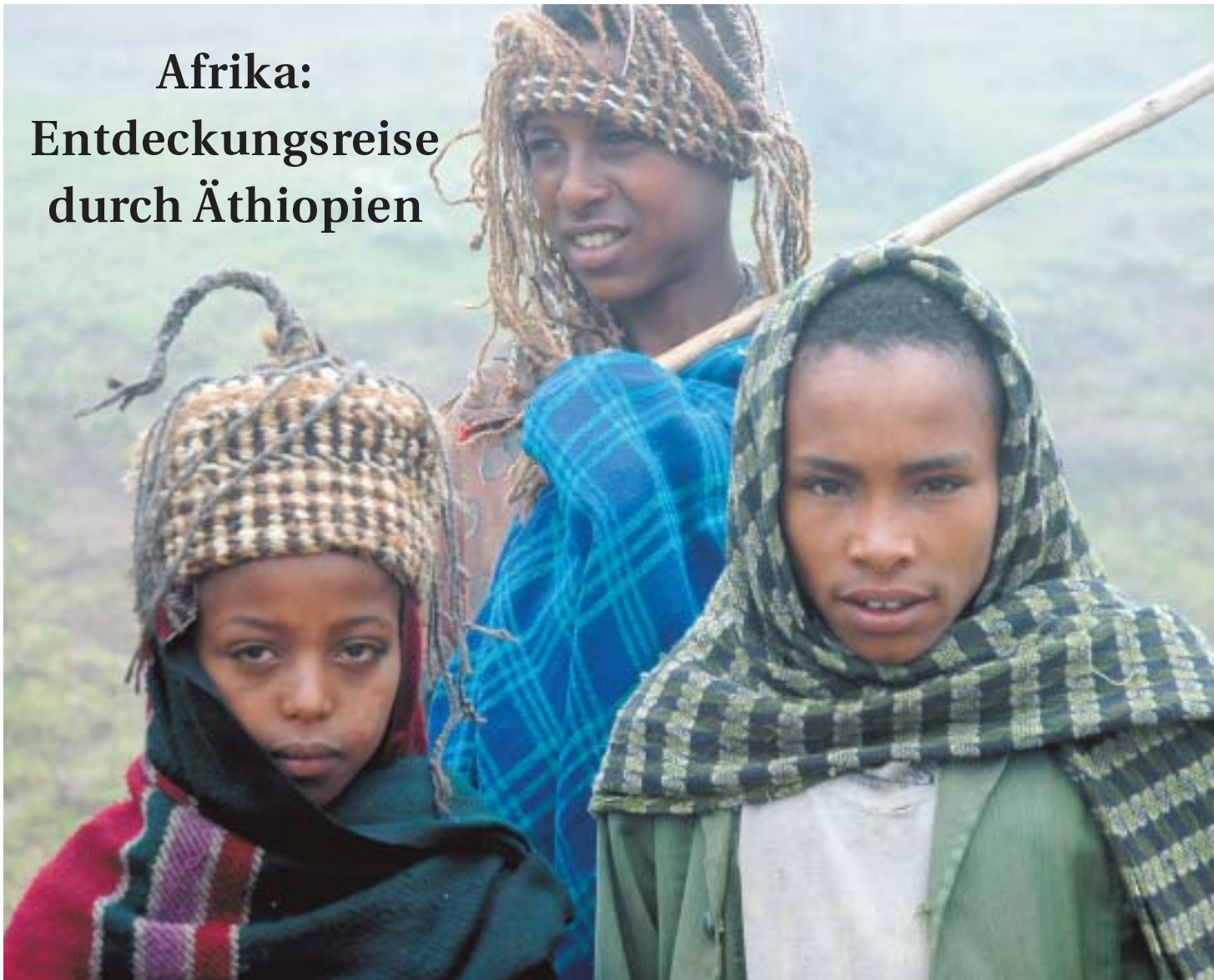
Drei Bauernjungen im Norden des Landes.